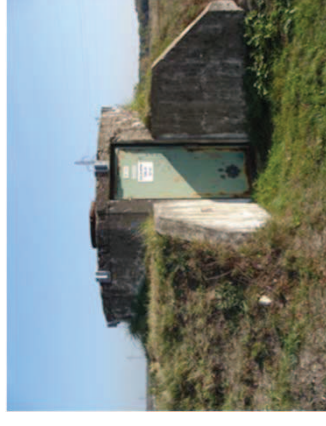
Généralisation de la méthode en 1984

A compter de 1976, arrêt de la progression de la salinité dans la nappe et récupération de la saumure infiltrée par des puits de fixation en pied de terril.